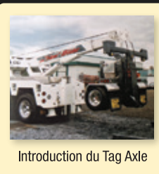
Introduction du Tag Axle