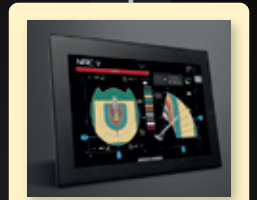
Première charte de levage dynamique en temps réel