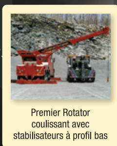
Premier Rotator coulissant avec stabilisateurs à profil bas