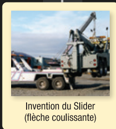
Invention du Slider (flèche coulissante)