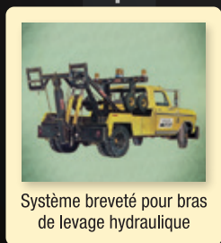
Système breveté pour bras de levage hydraulique