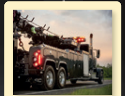
Première carrosserie monocoque en composite