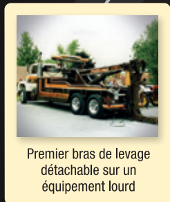
Premier bras de levage détachable sur un équipement lourd