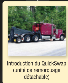
Introduction du QuickSwap (unité de remorquage détachable)