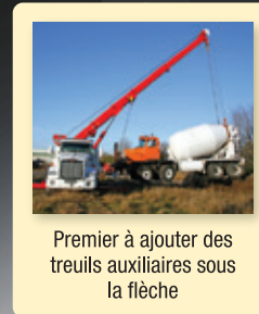
Premier à ajouter des treuils auxiliaires sous la flèche